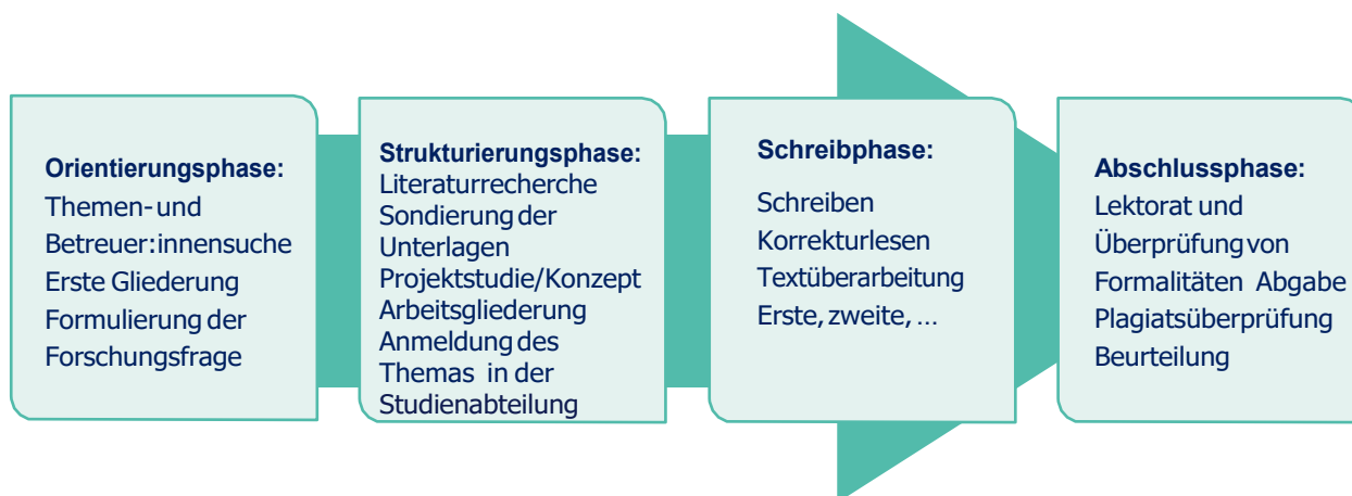
Abbildung 1: Der Weg zur fertigen Arbeit

Nach Abschluss der Schreibphase dringend erledigen: